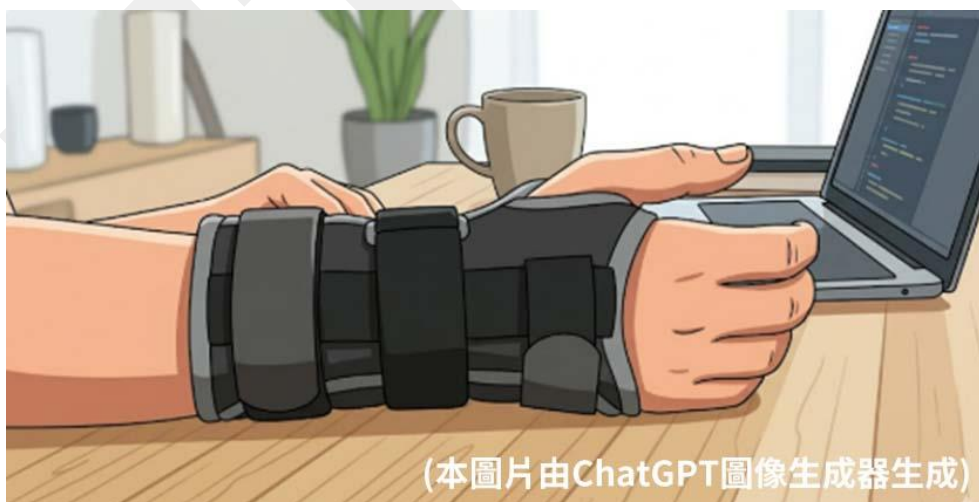
(本圖片由ChatGPT圖像生成器生成)