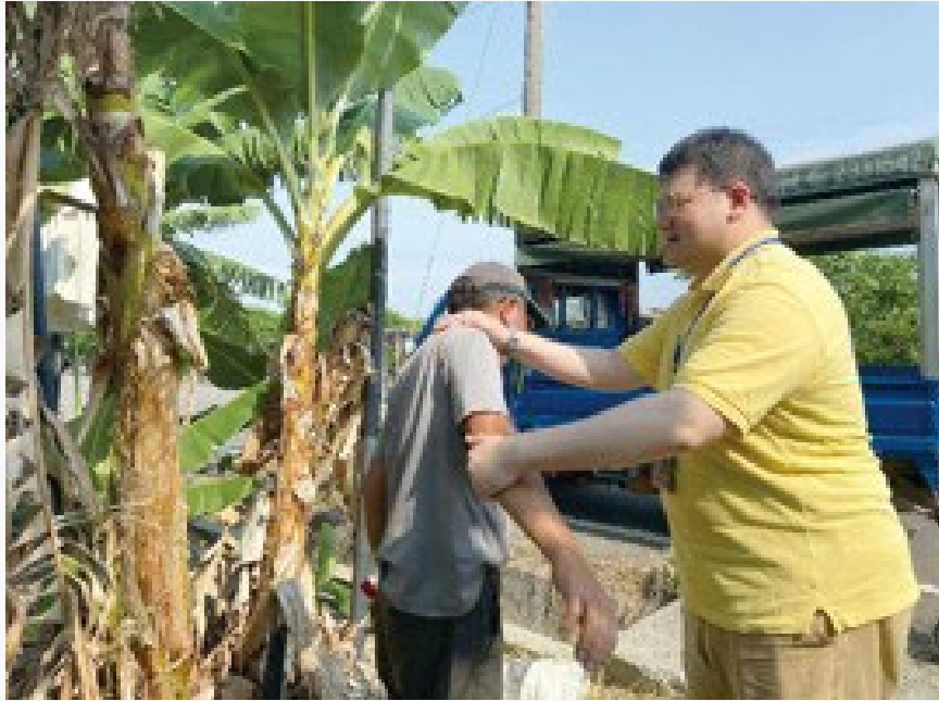
環境職業醫學部醫師(右)親自訪視，評估農業工作者之健康風險，並 提出改善與預防措施