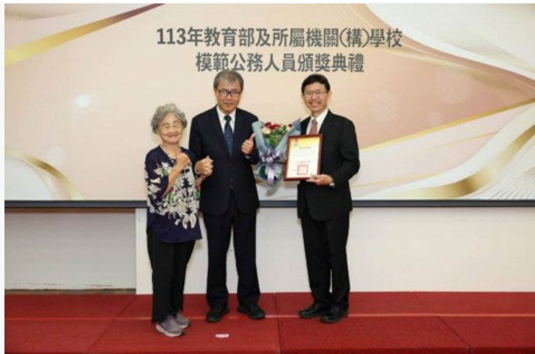
教育部表揚 113 年模範公務人員