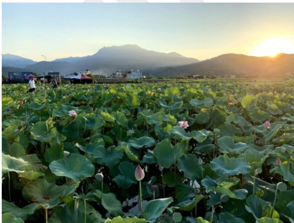
曾有西伯利亞白鶴停留的蓮花田