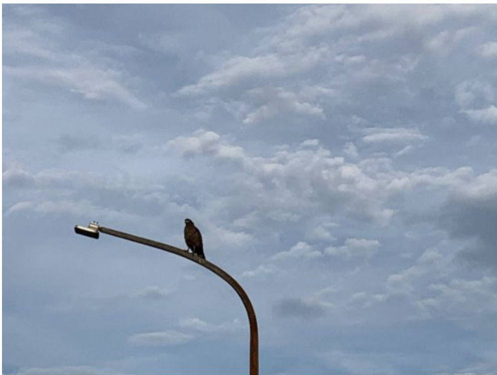
在醫院外玉爐路上拍到的老鷹