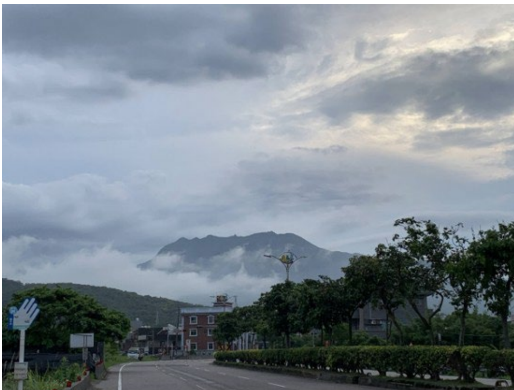
竹子山又被稱為美人山，因為從金山區看過去，山勢如同美人側臉