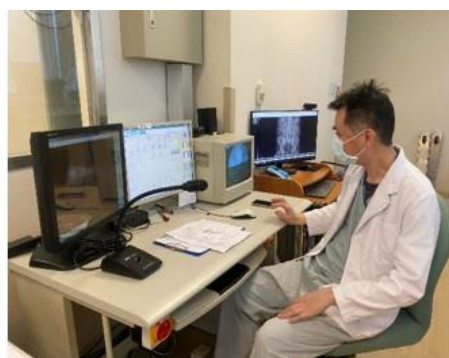
執行震波碎石治療業務