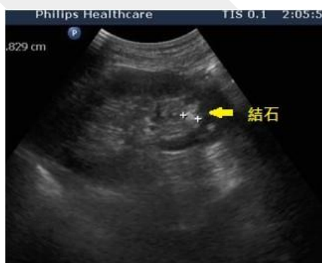
超音波掃描結石成像圖