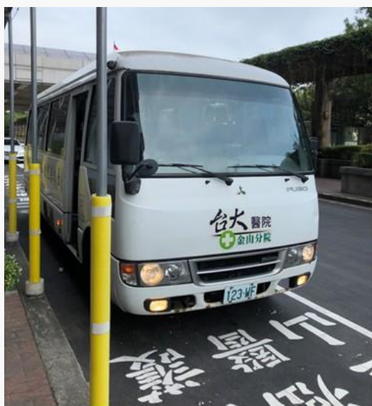
清早在總院門口等候我們的金山 小巴

到目前，我已來到金山約一年，逐漸領略了金山地區春、夏、秋、冬各種溫度跟風景，也感受到在偏鄉醫院服務的酸、甜、苦、樂。我想，金山分院以人為中心、承襲著最美的關懷文化，全院同仁跟醫護們站在一起，除了要讓這小小的醫院更專業、更具醫療水準外，更多的是希望讓這片居住的土地變得更美、更好、更有愛。