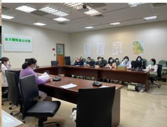
金山長者追加劑造冊施打籌備會