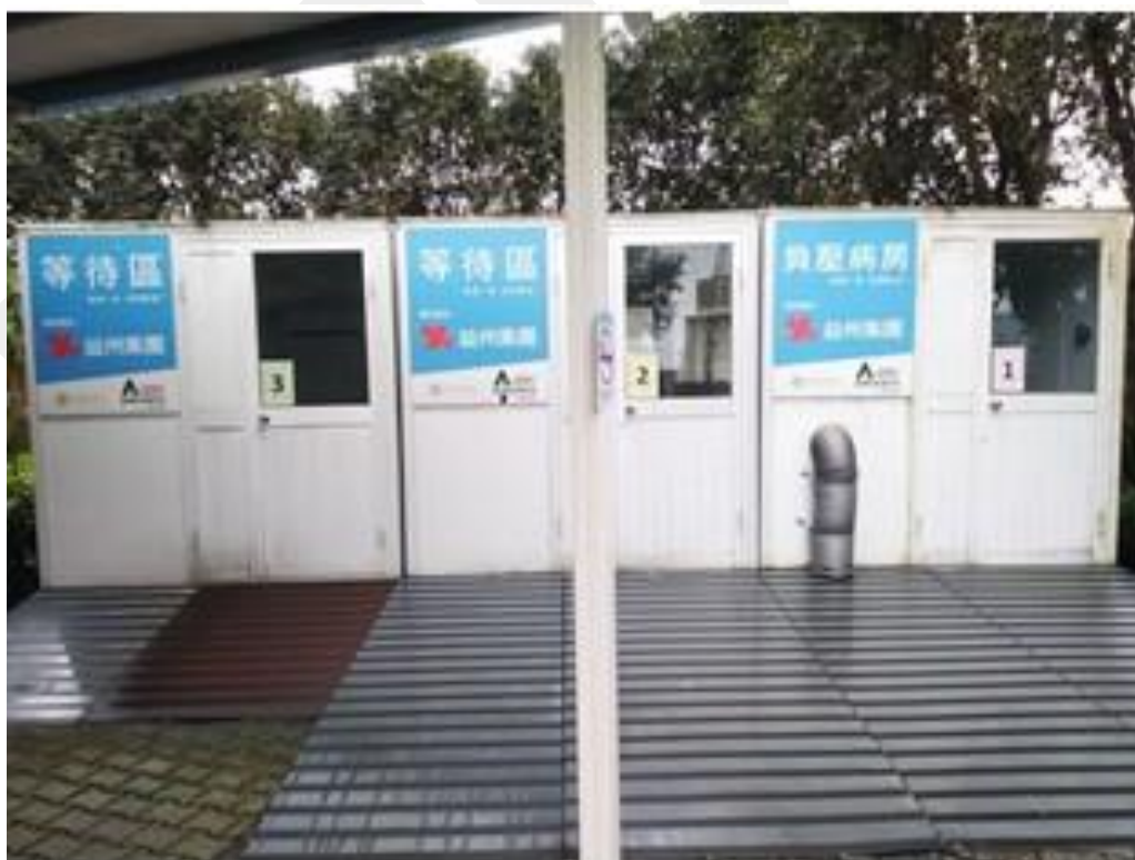
戶外組合屋，提供發燒呼吸道患者暫留觀察使用