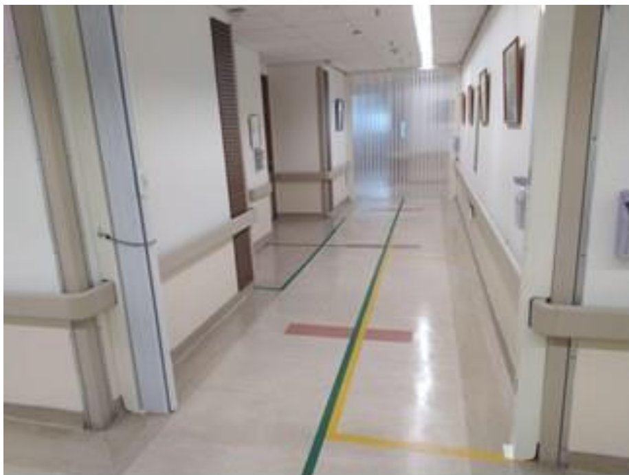
專責病房設置多道隔簾，以便逐間開設隔離區域