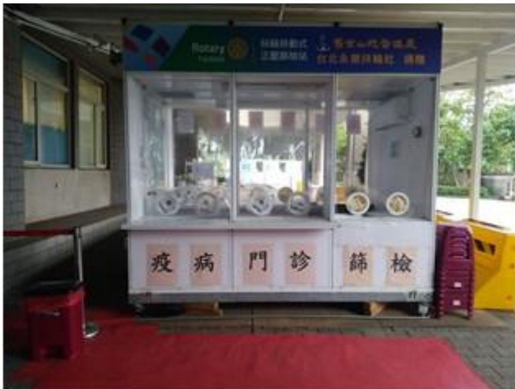
正壓採檢亭，一面為疫病門診使用，另一面為急診使用，分開感控動線