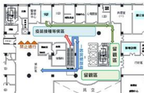
金山長者追加劑造冊施打動線