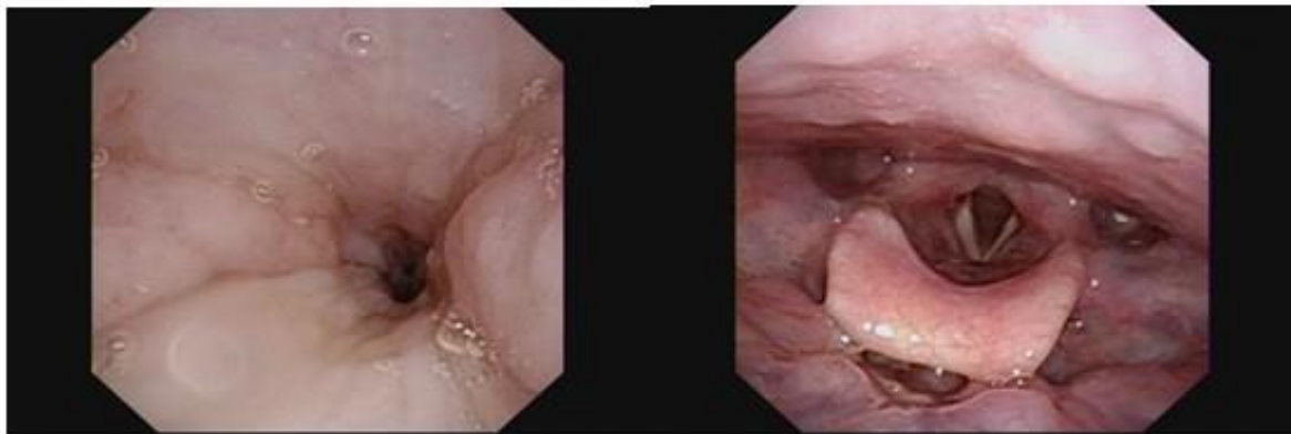
圖一 軟顎環狀阻塞