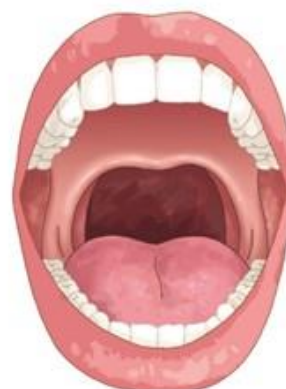
圖四 懸雍垂顎咽成型術術後