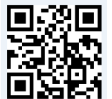
老人健檢資訊公告