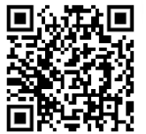
臺大醫院老人健檢網路取號