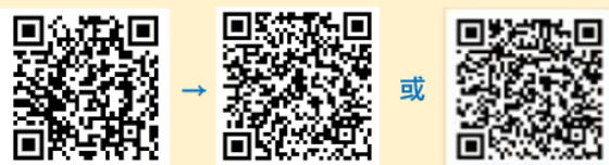
臺大醫院_網路取號 臺大醫院_本人登記 臺大醫院_陪同/代辦