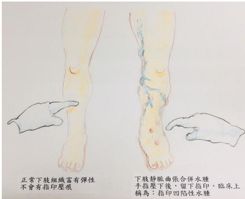
圖 2 小腿或腳踝腫脹示意圖