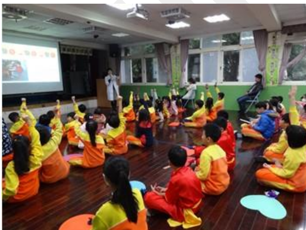
「校園意外預防與安全」講座