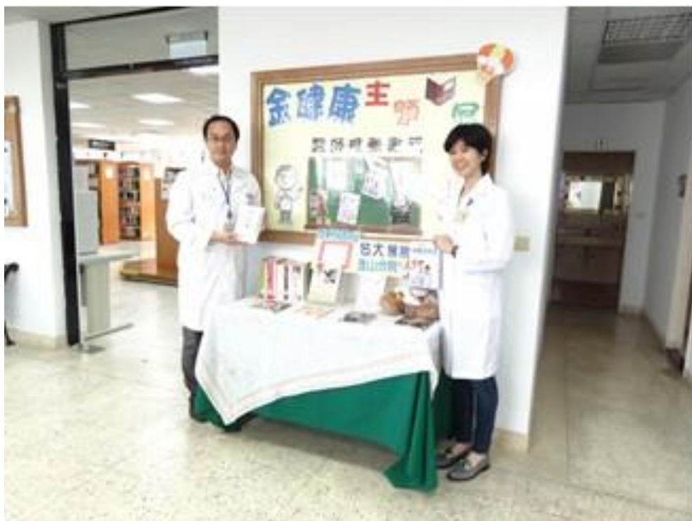
金山圖書館「金健康」書展