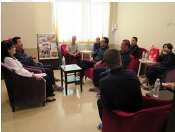
圖四 與萬里區里長們說明健檢服務