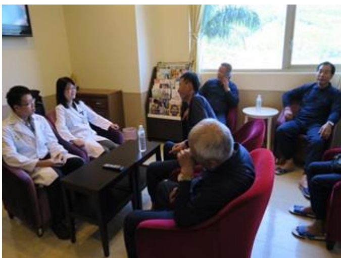
圖三 與金山區里長們說明健檢服務