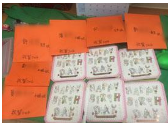
藉由卡片表達對病患的關心

安詳的在家中往生，家屬親自打電話至醫院告訴我們父親已經安詳辭世，非常感謝這段期間醫護人員之照護。由於透析護理人員與透析病患相處時間長，除了給與日常生活上的指導外，對於末期腎臟病的病人雖然未入住安寧病房，但藉由透析及居家安寧團隊共照，亦能接受安寧緩和照顧模式，協助病人面對生命最終的時光，提供身、心、靈各層面積極性的整體照顧，降低其痛苦至最低程度，同時享有生命的尊嚴，在熟悉的環境下離開，也幫助家屬調適喪親之哀慟，使臨終者的生命能夠劃下完美的句點。