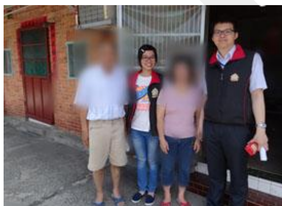
定期進行家庭拜訪瞭解居家的環境