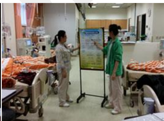
定期安排衛教給予日常生活上的指導