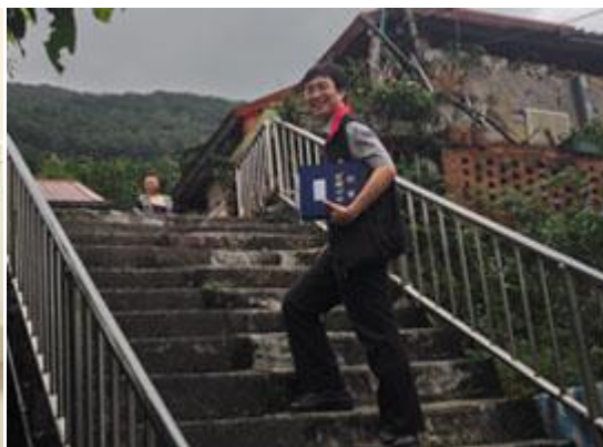
走出透析室深入家中訪視瞭解並關心病患的日常生活