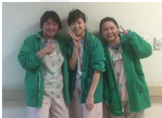
金山透析護理團隊