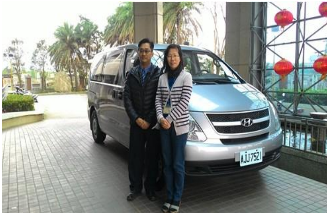
圖為總務室主任與車商點交的照片

後續由秘書室向捐贈者接洽後並取得捐贈意願相關資料，便開始辦理領車、驗車、保險、領牌等流程，向基隆監理站洽詢後了解個人捐贈車輛與公家單位需要注意的事項，以便減少往返監理站處理手續的時間。