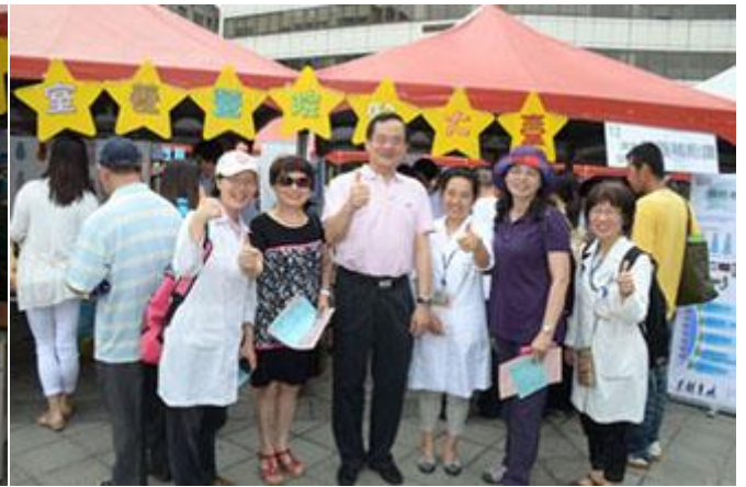
活動圓滿成功，長官們也說讚啦！