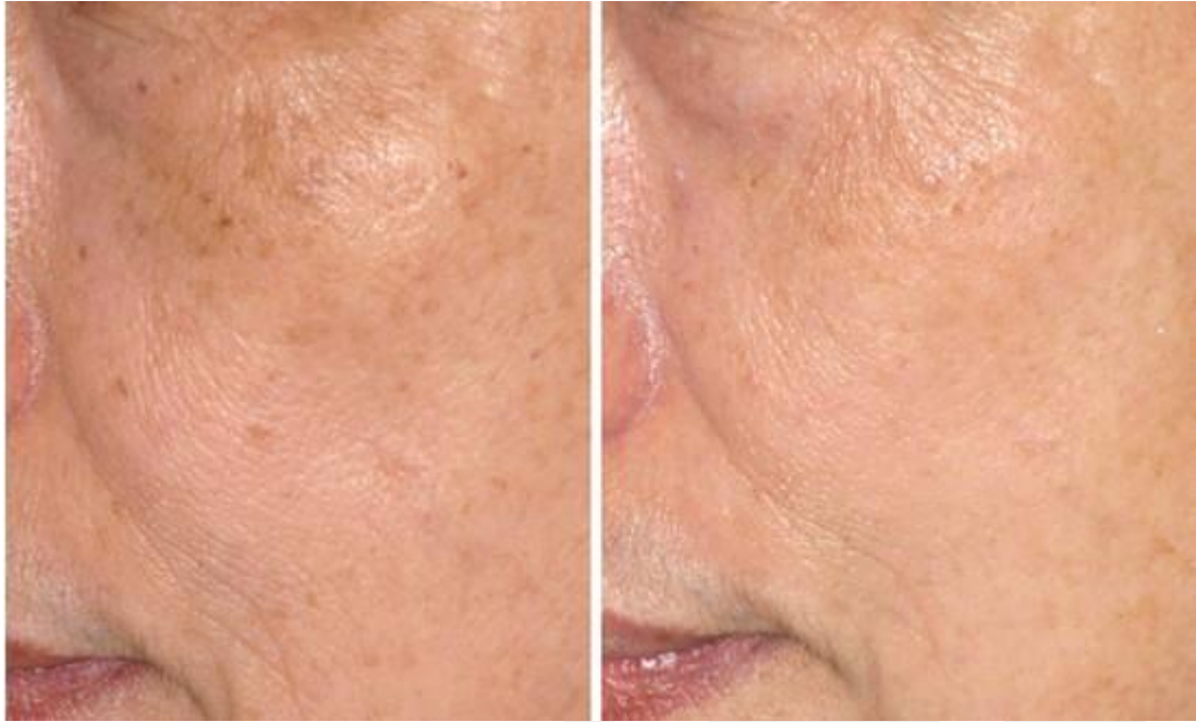
圖二 左：曬斑治療前 右：曬斑經紅寶石雷射治療後

「廖醫師，我臉上及身上有好幾個粗粗厚厚的棕黑色凸起物，表面還有一點脫皮，這會不會是皮膚癌？」