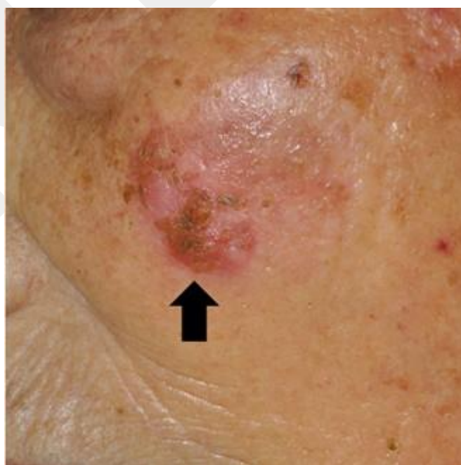
圖四 紅色糜爛斑塊為癌前期的日光性角化症，周圍棕色斑點為曬斑

曬斑及脂漏性角化症的處理並不複雜，治療效果一般也令人感到滿足，但其實最重要的還是要有正確的診斷，因為異型痣還有惡性的皮膚癌，如基底細胞癌、惡性黑色素細胞癌，波文氏症等，在臨床上都需要和脂漏性角化症做區別。也有病患的基底或黑色素細胞癌，在經冷凍治療後又復發擴散的案例。癌前期的日光性角化症，臨床上看起來是紅色脫皮斑塊，有時也會夾雜產生在曬斑之中（圖四）。所以除了平日做好正確防曬，預防皮膚老化及皮膚癌，也要定期檢查身上各處的皮膚色素斑塊，特別是足底部、腳趾及指甲下，這些部位是臺灣民眾惡性黑色素細胞癌最好發的地方，一旦有疑慮要到皮膚專科醫師處求診，有正確診斷才能有適當的治療，擁有一個 Happy 的皮膚人生。