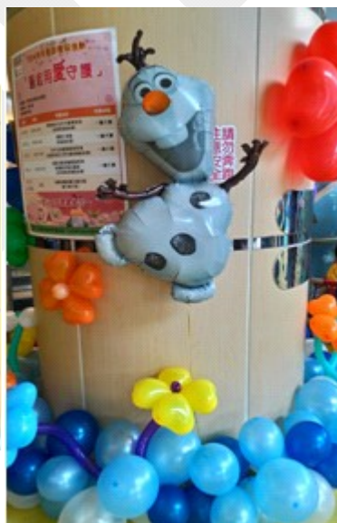
兒醫大樓大廳佈置(照相區)