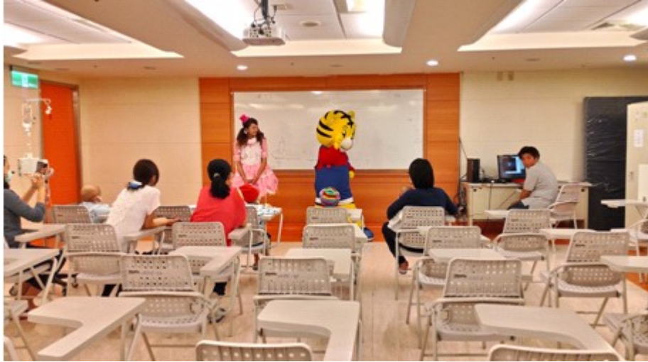
巧虎在病房討論室帶來精采的帶動唱表演