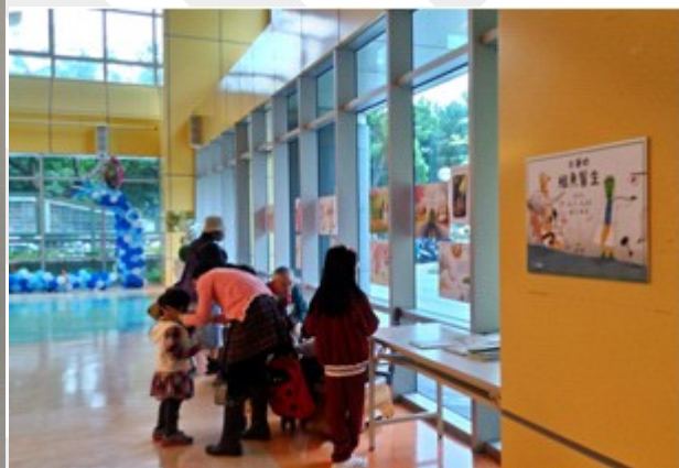
兒醫大廳繪本展覽