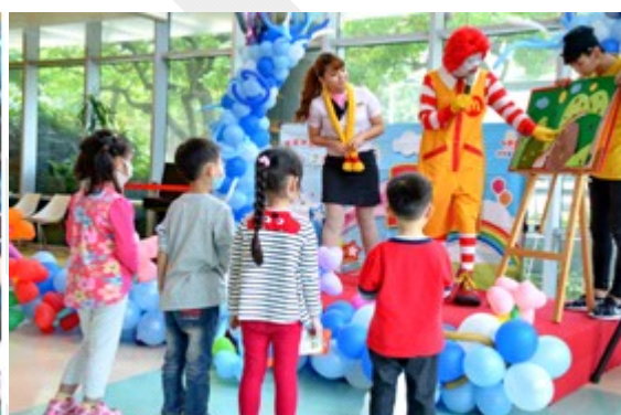
麥當勞叔叔說故事