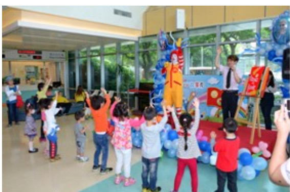
麥當勞叔叔與小朋友互動

除了在大廳表演，麥當勞叔叔也到病房與病童互動，並贈送繪本，幫住院的小朋友加油打氣；麥當勞叔叔還特別到護理站與行政單位，讓工作人員也感受到兒童節的溫馨歡樂氣氛。