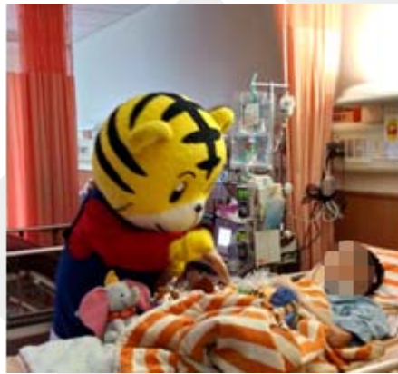
巧虎至病房幫小朋友加油打氣