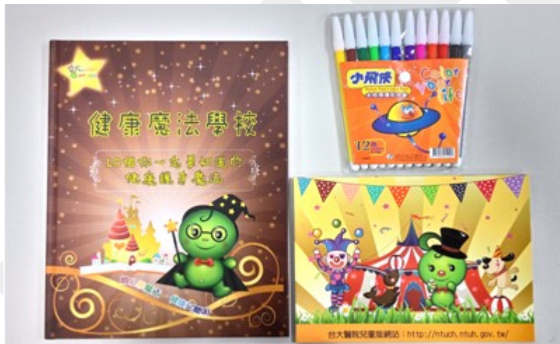
兒童節禮物－健康魔法學校繪本、Q比繪本、彩色筆

希望在這個特別的日子裡，院方為病童們籌劃的兒童節慶祝系列活動，能讓病童們暫時一掃看病時與住院時的焦慮與恐懼，讓他們回到本來就屬於他們的無憂無慮的快樂童年。臺大醫院祝福所有小朋友、大朋友身體健康、萬事如意！