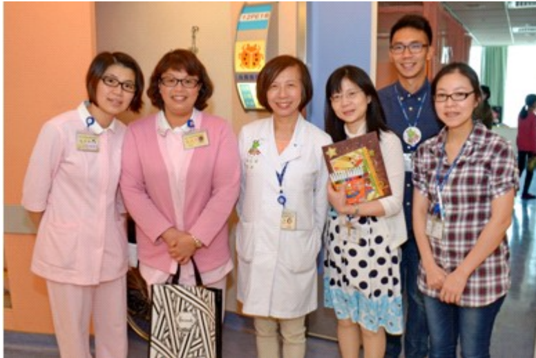
吳院長送禮物大隊