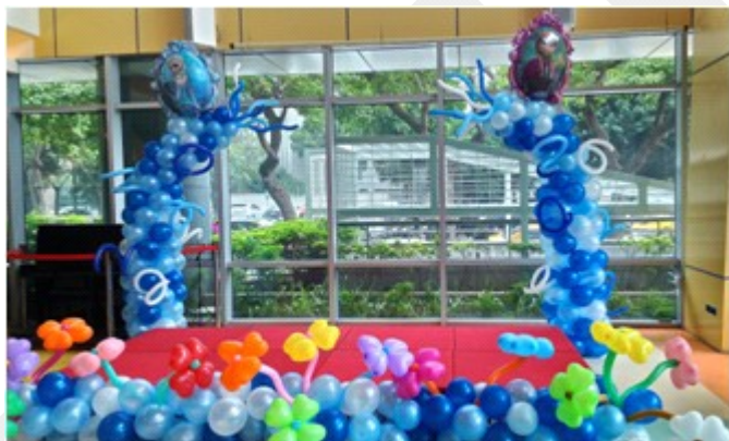
兒醫大樓大廳舞臺佈置

今年兒童節場地佈置選用風靡全球小朋友的冰雪奇緣為主題，讓醫院的大廳充滿歡樂，也讓小朋友一掃踏進醫院時的焦慮感，開開心心的跟 Elsa, Anna 與雪寶合照。 以下是每個活動的精彩回顧：