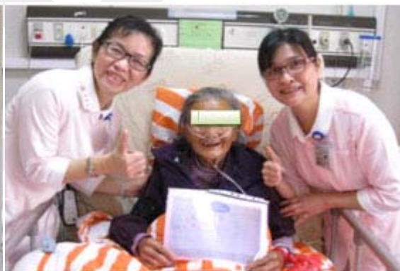
圖五 將祝福印製給阿嬤留念