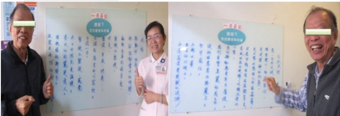
圖一 祝福移動靈巧的翅膀，翱翔在病房

您，白衣天使，擁有愛心、耐心、用心， 是守護神的化身， 是大慈大悲的人間活菩薩。 清晨甘露因您而滋潤草木， 春風因您而吹拂，喚醒沉睡的心靈。 您們期盼患者早日康復，您們希望美麗的花朵， 綻放在患者的臉龐上。 堅守崗位，不離不棄，患者的心湖上， 永遠蕩漾著感激的漣漪（圖二）。