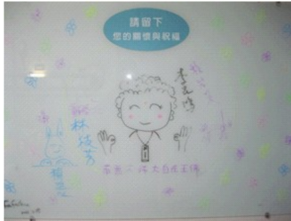
圖八 佛菩薩保佑阿嬤早日恢復健康

傳遞關懷的園地拉近了照顧者與被照顧者間之距離，希望藉此營造一個充滿愛的環境，讓施與受一樣幸福。