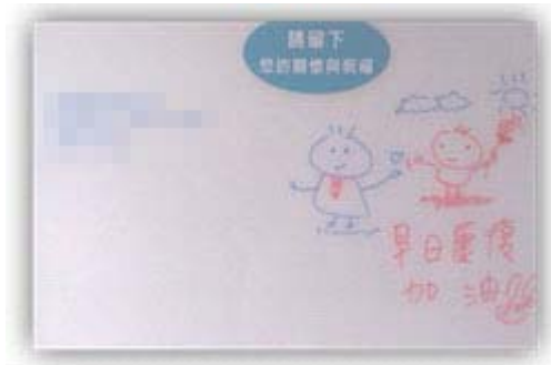
圖三 印尼籍照顧者對 PAPA 的祝福