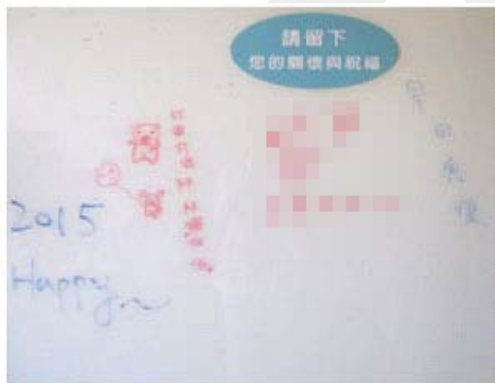
圖四 拉著氣球的小豬～病痛飛走了

曾祖母說：「我不認識字，只知道她在那裏畫。」我們告訴阿嬤，甘阿孫塗鴉中所表達的關懷意涵(圖四)。曾祖母說：「我的甘阿孫好棒哦，過年我要多包一些紅包給她。」阿嬤很開心的答應拍照片，要拍照時，曾祖母說：「這照片會給很多人看，所以我要坐得直直正正的，頭髮也要梳整齊，過年我要把這照片給兒子、女兒、還有孫女看。」（圖五）