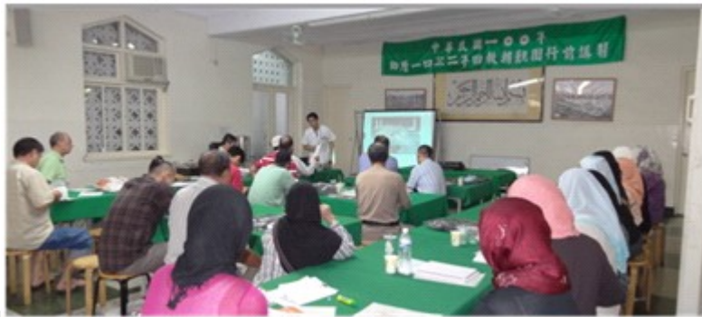
圖七 麥加朝聖者之行前團體衛教

針對某些特殊族群，例如留學生、孕婦、老人、小孩、慢性病患者、癌症或免疫力不足等狀況，面臨的健康威脅和一般的旅行者又不一樣。旅行時常伴隨著不同的作息、不同的氣候、不同的食物，甚至不同的身心壓力，這些干擾因素會打亂了原本體內的平衡，可能會讓原本控制良好的疾病變得不穩定，這些都需要特別的注意。這些人更需要在出國前，到旅遊醫學門診諮詢。有萬全的準備，才能確保每趟旅行都快樂出門、平平安安回家。