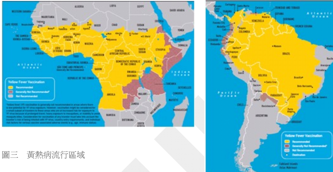
圖三 黃熱病流行區域

行性腦脊髓膜炎分布在非洲撒哈拉沙漠附近，還有回教聖地麥加。這兩種疫苗打完後，會得到一本俗稱「黃皮書」的國際預防接種證明書，走到全世界都有效喔，請好好把它跟護照放在一起吧。