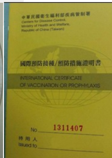
圖二 國際預防接種證明書 (黃皮書)

首先，介紹旅遊醫學的兩大明星給大家：黃熱病和流行性腦脊髓膜炎。這兩個病之所以有名，是因為它們的疫苗有「強制性」。有的國家規定，沒打疫苗就不能入境，因此要出發前一定要先問清楚，免得被拒於國門之外，敗興而歸。黃熱病是一種藉由蚊子叮咬傳染的傳染病，有致死的可能性，流行於非洲、南美洲，至少要提早十天到旅遊門診打疫苗。流