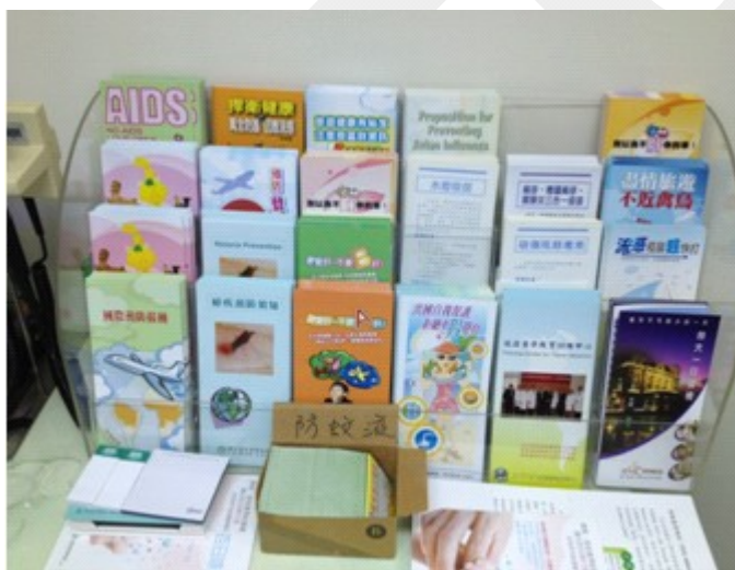
圖一 臺大旅遊醫學門診提供的衛教單張

根據觀光局統計，2013 年國人出國人數總計 1105 萬人次，再創歷年新高。然而，卻只有少數民眾會於出國前尋求旅遊健康諮詢。近年來世界各地紛紛爆發傳染病，從禽流感、H5N1、中東呼吸症候群冠狀病毒，到最嚴重、死亡率最高的伊波拉病毒，都顯示在人口日益增多、國際間交流密切的背景下，疾病的發生與傳播機率上升，若是旅遊地區的公共衛生條件不佳，旅客對當地疾病情況不了解，都會使國人在旅行中的健康受到威脅。