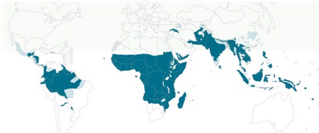
圖六 瘧疾分布地圖

預防瘧疾的藥物有四種可選，價錢、用法、可能的副作用都不太一樣，而且瘧疾有分好幾種，不同國家地區的瘧疾可能有一樣的抗藥性。因此該用哪種預防藥物，需要醫師專業的判斷。有些預防用藥需要提前兩週開始吃才能發揮藥效，所以一旦決定了行程，愈早來看旅遊醫學門診愈好。