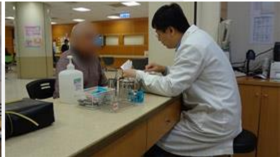
檢醫組組長為民眾解釋血機比對結果