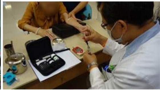
檢醫組同仁為民眾做血糖比對