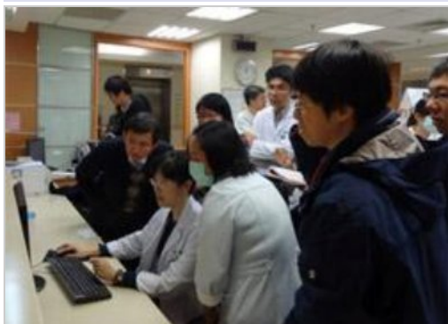
病房護理站確認醫師是否熟練