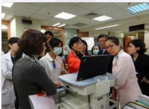
護理工作車一切就緒