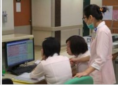
病房護理作業全面升級