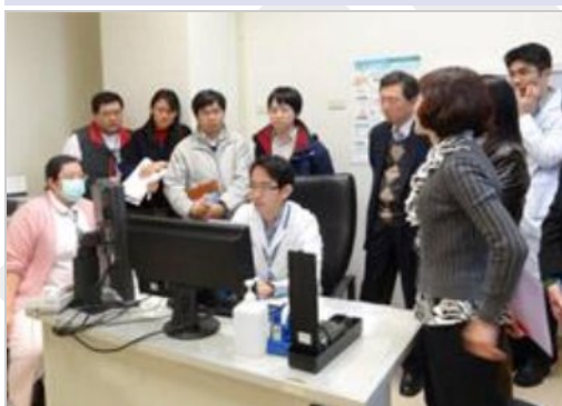
確認診間系統是否運作順利