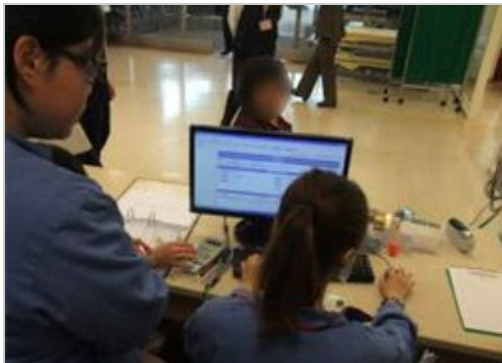
急診檢傷共同上線