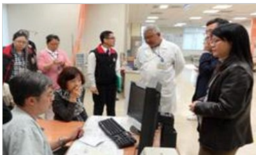
金山分院急診系統模擬操作