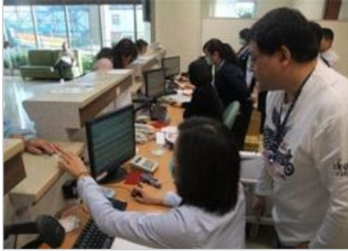
沒關係~加開櫃檯給民眾最優質的服務