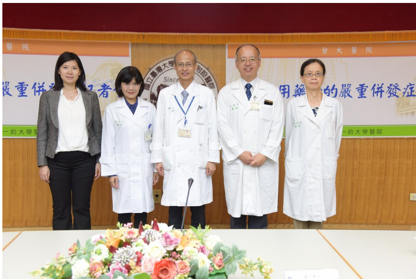
新興濫用藥物鑑定團隊